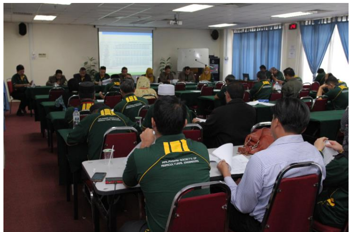
Gambar 7: Semangat dan sokongan Ahli-ahli MSAE dengan kehadiran yang amat membanggakan