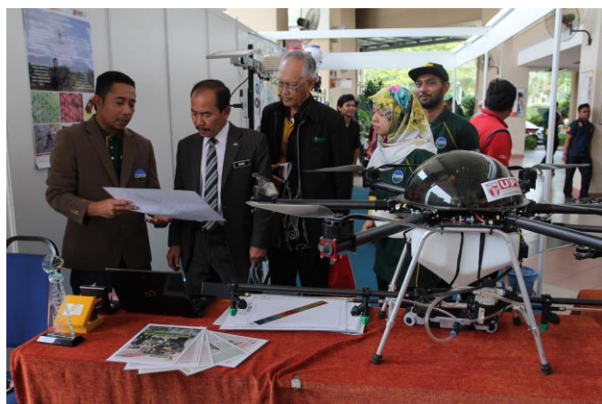
Gambar 1: (a) YBhg. Dato' Seri Ismail memberikan ucapan pada majlis perasmian dan (b) Lawatan ke Pameran Agro-Technology oleh YBhg. Dato Seri Ismail

Sempena dengan konvensyen ini, MSAE telah menyerahkan "Resolusi dari Mesyuarat Agong Tahunan ke-33 Persatuan Jurutera Pertanian Malaysia 2016" kepada YBhg. Dato' Seri ismail.