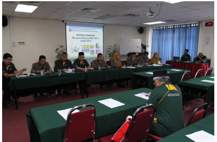
Gambar 6: Mesyuarat Agung Tahunan (AGM) ke-34 yang dipengerusi oleh Presiden MSAE sesi 2015-2017