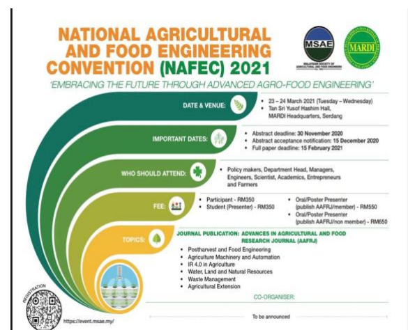
Gambar 7: Poster Konvensyen Kebangsaan Kejuruteraan Pertanian dan Makanan (NAFEC) 2021

MARDI dan MSAE akan bekerjasama dalam menganjurkan Konvensyen Kebangsaan Kejuruteraan Pertanian dan Makanan pada 23 dan 24 Mac 2021. Konvensyen ini akan diadakan di Dewan Tan Sri Yusof Hashim, Ibu Pejabat MARDI, Serdang, Selangor. Tujuan konvensyen ini diadakan adalah sebagai salah satu usaha untuk memastikan industri pertanian dan makanan lebih berdaya saing di peringkat global dengan memberi keutamaan dan penghasilan produk pertanian yang berkualiti. Semua ahli MSAE digalakkan menyertai NAFEC2021 yang akan diadakan ini. Maklumat terperinci dan untuk pendaftaran adalah pada talian berikut; https://event.msae.my/