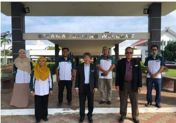
Gambar 1: Kunjungi hormat Exco MSAE kepada KP LPP