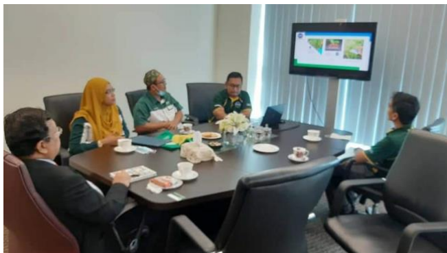
Gambar 5: Kunjungan hormat kepada KP Jabatan Pendidikan Politeknik dan Kolej Komuniti