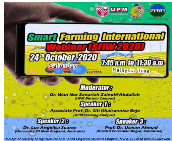
Gambar 6: Program Smart Farming International Webinar (SWIF2020)

Pada 24 Oktober 2020, MSAE-SC (UPM-Bintulu) telah menganjurkan Program "Smart Farming International Webinar 2020 (SFIW2020)". Program ini dilaksanakan secara atas talian dengan menggunakan platform Webex. Program ini dijalankan untuk memberi pendekatan kepada para belia, pelajar dan orang awam berkaitan dengan kaedah Smart Farming selain memberi peluang untuk masyarakat mempelajari kaedah dan teknologi terkini di dalam bidang pertanian. Sambutan yang amat menggalakan dengan seramai 450 peserta menyertai SFIW2020 ini.