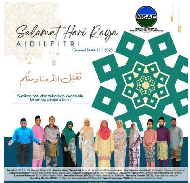
Gambar 3 : Poster Sambutan Hari Raya Aidilfitri 1444H

Presiden dan Exco MSAE sesi 2023/2025 ingin mengucapkan Selamat Hari Raya Aidilfitri. Maaf zahir dan batin kepada semua ahli MSAE. Kemeriahan sambutan syawal kali ini lebih bermakna setelah sekian lama tidak bersua.