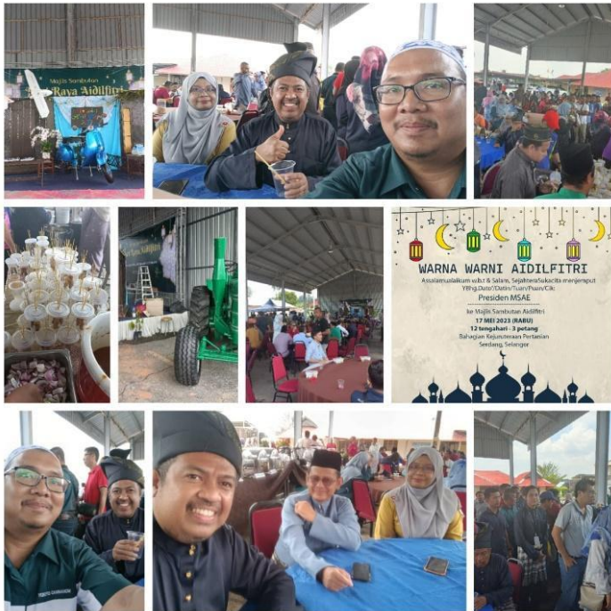
Gambar 4 : Majlis jamuan hari raya anjuran Bahagian Kejuruteraan Pertanian, Selangor.

Pada 17 Mei yang lalu, wakil Exco MSAE telah menghadiri majlis jamuan raya anjuran Bahagian Kejuruteraan Pertanian Serdang, Selangor. Selain dapat menjamu selera dengan pelbagai hidangan yang disediakan, Exco MSAE juga berkesempatan untuk saling bertukar pandangan dan aktiviti terbaru mengenai Kejuruteraan Pertanian.