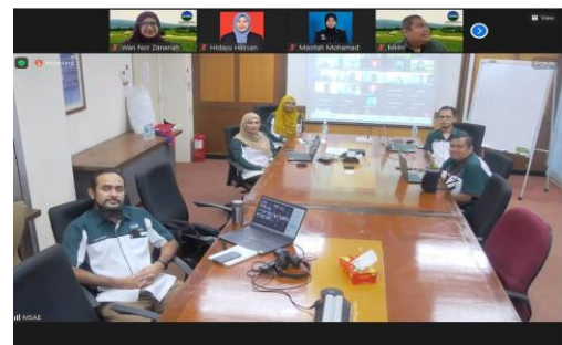
Gambar 8: Sesi bergambar bersama ahli Mesyuarat