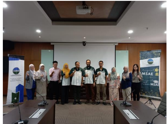
Gambar 7: Sesi bergambar bersama juri Anugerah Tesis Terbaik MSAE 2023

Pada 14 Februari 2024, Bengkel Penjurian Anugerah Tesis Terbaik MSAE telah diadakan secara fizikal di Fakulti Kejuruteraan, UPM. Enam orang juri dari pelbagai universiti telah dijemput bagi mengadakan anugerah yang akan diberikan semasa NAFEC 2024.