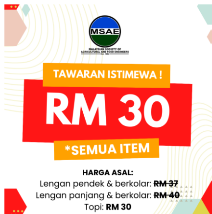
Gambar 5: Poster potongan harga promosi baju & topi MSAE

MSAE telah mengadakan promosi jualan penghabisan baju dan topi MSAE dengan potongan harga kepada RM30 bagi semua item. Promosi ini memberi peluang semua ahli sedia ada dan baharu untuk mendapatkan “signature” item persatuan MSAE dengan harga terendah.