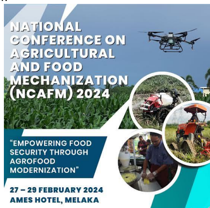
Gambar 6: Poster NCAFM 2024

Pada 27 hingga 29 Februari 2024, pihak MARDI telah menganjurkan konferensi NCAFM 2024 yang bertemakan “Empowering Food Security Through Agrofood Modernization”. Program berlangsung secara fizikal yang bertempat di Ames Hotel Melaka. Peserta boleh memilih sama ada untuk menyertai sebagai oral atau poster presentation . MSAE sebagai penganjur bersama NCAFM 2024.