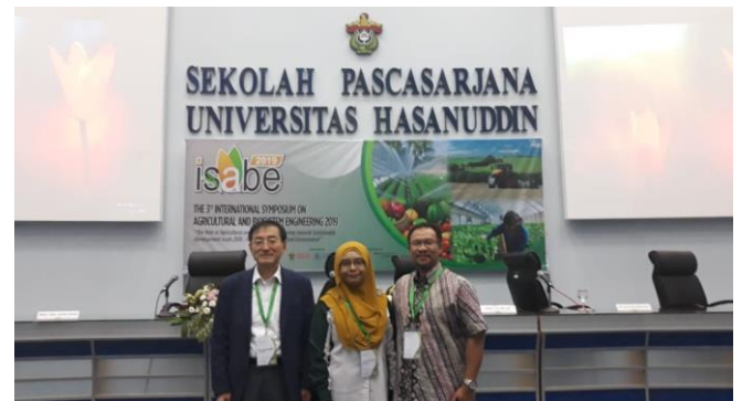
Gambar 3: Presiden MSAE Bersama Presiden ISAE and KSAM

Pada 7 Ogos 2019 yang lalu, Presiden MSAE telah menghadiri ISABE2019 dan menjadi pembentang ucap tama di 3 rd International Symposium on Agricultural and Biosystem Engineering (ISABE2019) yang berlangsung di Universitas Hasanuddin, Makassar, Indonesia. Konferens yang berlangsung pada 6-8 Ogos 2019 turut dihadiri Presiden PERTETA dan KSAM (Korean Society of Agricultural Machinery).