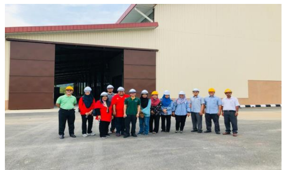
Gambar 4: Lawatan teknikal Exco MSAE ke Kilang Padi.

Pada 15 Ogos 2019 yang lalu, dengan kerjasama dan jempunan dari Lembaga Pertubuhan Peladang, satu lawatan teknikal oleh EXCO MSAE telah diadakan di kilang vitato, Kg. Tembila, Terengganu. Tujuan lawatan ini adalah bagi melihat potensi pengoperasian kilang vitato di dalam mengkomersialkan tepung vitato bagi pasaran di Malaysia. EXCO juga turut melawat Kilang Padi milik LPP di Gerai, Terengganu.