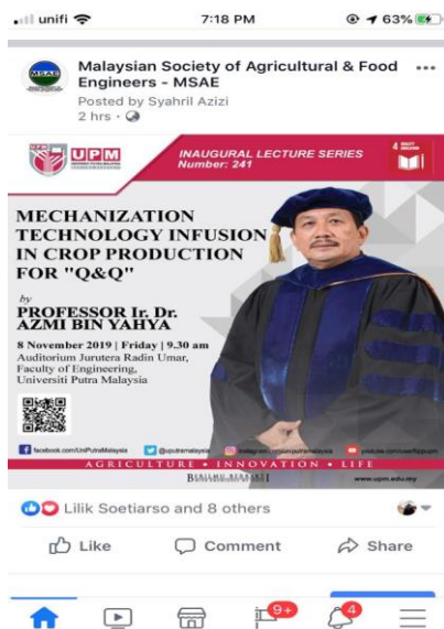
Gambar 11: Poster hebahan inaugural Mantan Penasihat MSAE di laman mukabuku MSAE.