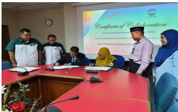
Gambar 2: Majlis memeterai NDA antara MSAE dan PKB

Pada hari yang sama juga, MSAE telah menandatangani NDA bagi memperbaharui kerjasama dengan PKB.