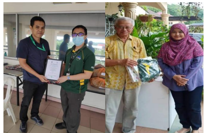
Gambar 5: Penyerahan ' goodies bags ' kepada wakil LGM dan UMS