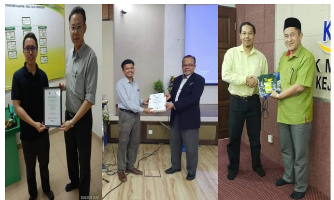
Gambar 6: Penyerahan ' goodies bags ' kepada wakil MARDI, Jabatan Pertanian dan KADA