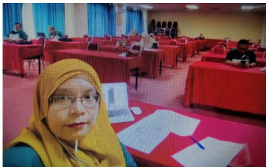
Gambar 2: Mesyuarat Agung Tahunan MSAE kali ke-37

Mesyuarat Agung Tahunan (AGM) MSAE kali ke-37 yang seharusnya berlangsung pada 8 April 2020 di Dewan Tan Sri Abu Zahar, Lembaga Pertubuhan Peladang, Kuala Lumpur telah ditunda ketarikh yang baharu iaitu 30 Jun 2020. Pihak Persatuan Jurutera Pertanian dan Makanan Malaysia (MSAE) telah merancang untuk mengadakan AGM bersempena Konferen MSAE 2020 bertemakan "Makanan Kita Masa Depan Kita" pada 7-8 April 2020, namun disebabkan untuk menghindari penyebaran pandemik Covid-19, AGM telah diadakan secara berasingan dari Konferens Webinar 2020 secara maya. Mesyuarat Agung Tahunan pada kali ini telah diadakan melalui secara atas talian dengan menggunakan aplikasi Zoom Meeting dengan mengamalkan norma baharu. EXCO yang berdekatan berkumpul di Bilik Seminar, Fakulti Kejuruteraan dengan mengamalkan penjarakan sosial. Walaupun terdapat kekangan dari segi perjumpaan secara berkumpul dalam jumlah yang ramai, mesyuarat kali ini tetap mendapat sambutan yang menggalakkan. Terima kasih di atas kerjasama dan sokongan yang diberikan dari ahli MSAE.