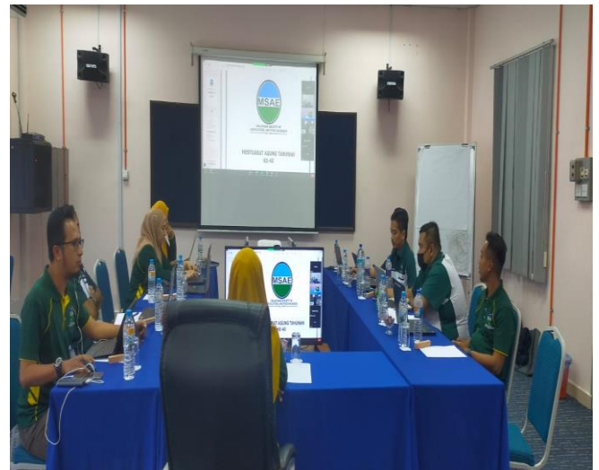
Gambar 3 : Mesyuarat Agung Tahunan ke-40 secara hybrid di Institut Latihan Fama, Port Dickson, Negeri Sembilan.

Pada 9 Mac 2023, MSAE telah mengadakan Mesyuarat Agung Tahunan kali ke-40 secara hybrid di Institut Latihan Fama, Port Dickson, Negeri Sembilan. Ahli dimaklum pembubaran Ahli Jawatankuasa MSAE Sesi 2021/2023. Pelantikan baru Ahli Jawatankuasa MSAE untuk sesi 2023/2025 dilakukan melalui undian ahli MSAE.