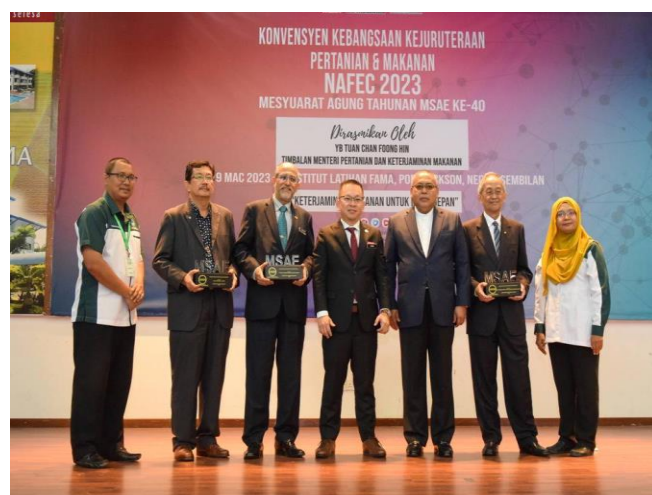
Gambar 6 : Sesi bergambar bersama penerima Anugerah MSAE 2023