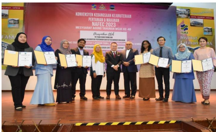
Gambar 5 : Sesi bergambar bersama pemenang Anugerah Tesis Terbaik MSAE 2022

Persatuan Jurutera Pertanian dan Makanan Malaysia (MSAE) buat julung kalinya telah mewujudkan Anugerah Tesis Terbaik MSAE untuk memberi pengiktirafan kepada graduan Bachelor, Master dan PhD yang telah memperkasa kajian dalam bidang sains, teknologi dan kejuruteraan pertanian atau makanan. Anugerah ini terbuka kepada pelajar warganegara Malaysia peringkat Bachelor, Master dan PhD sesi 2022 universiti awam.