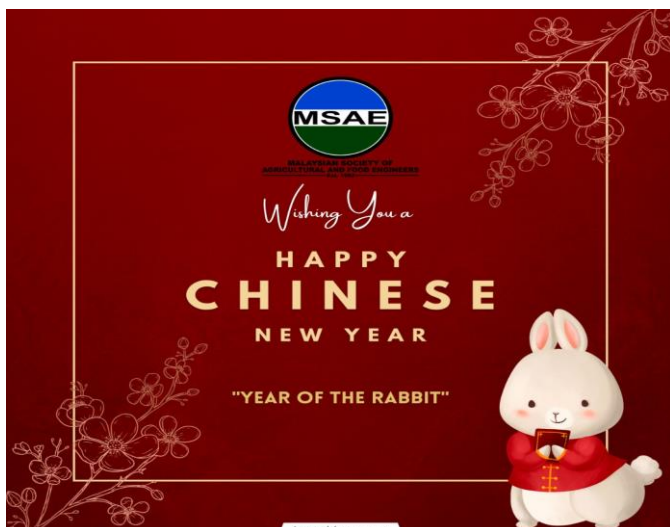
Gambar 2 : Poster Sambutan Tahun Baru Cina

Selamat menyambut Tahun Baru Cina. Exco MSAE mengucapkan Selamat Tahun Baru Cina 2023 kepada ahli MSAE yang beragama Buddha.