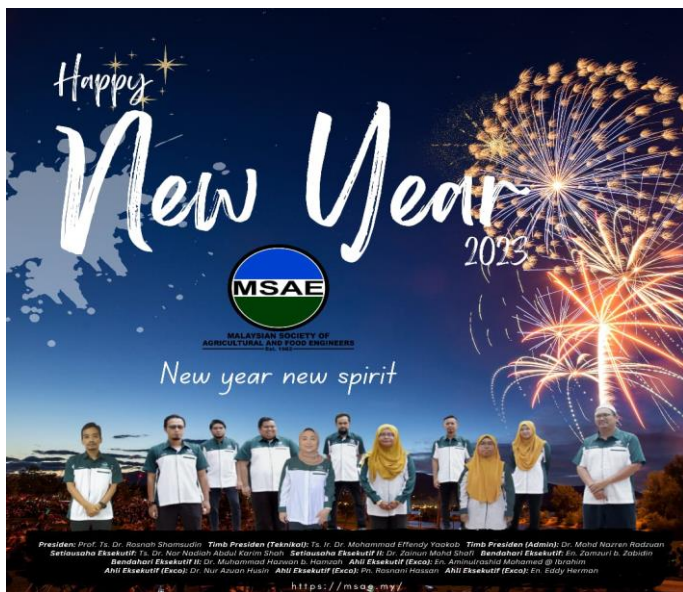
Gambar 1 : Poster Sambutan Tahun Baru

Exco MSAE mengucapkan selamat tahun baru 2023. Semoga tahun ini memberi lebih kecemerlangan kepada semua ahli MSAE.